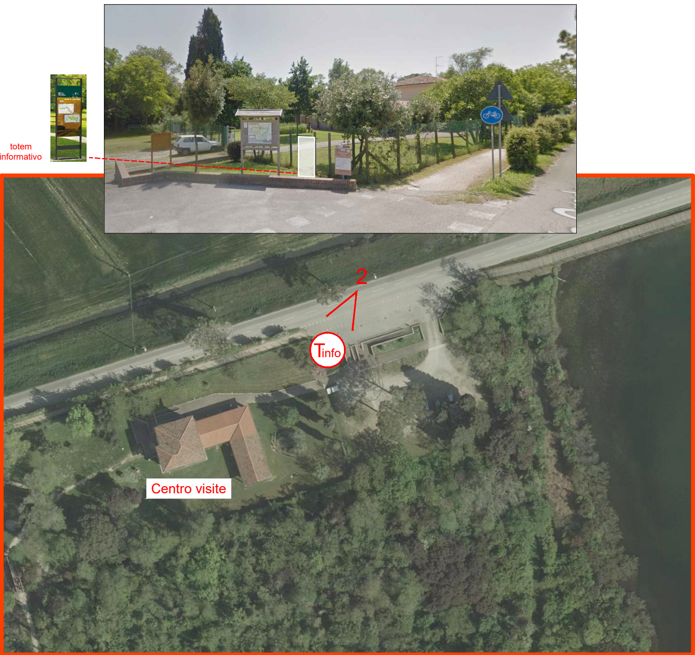
CENTRO VISITE DI VALLE CAVANATA - SCALA 1:1.000