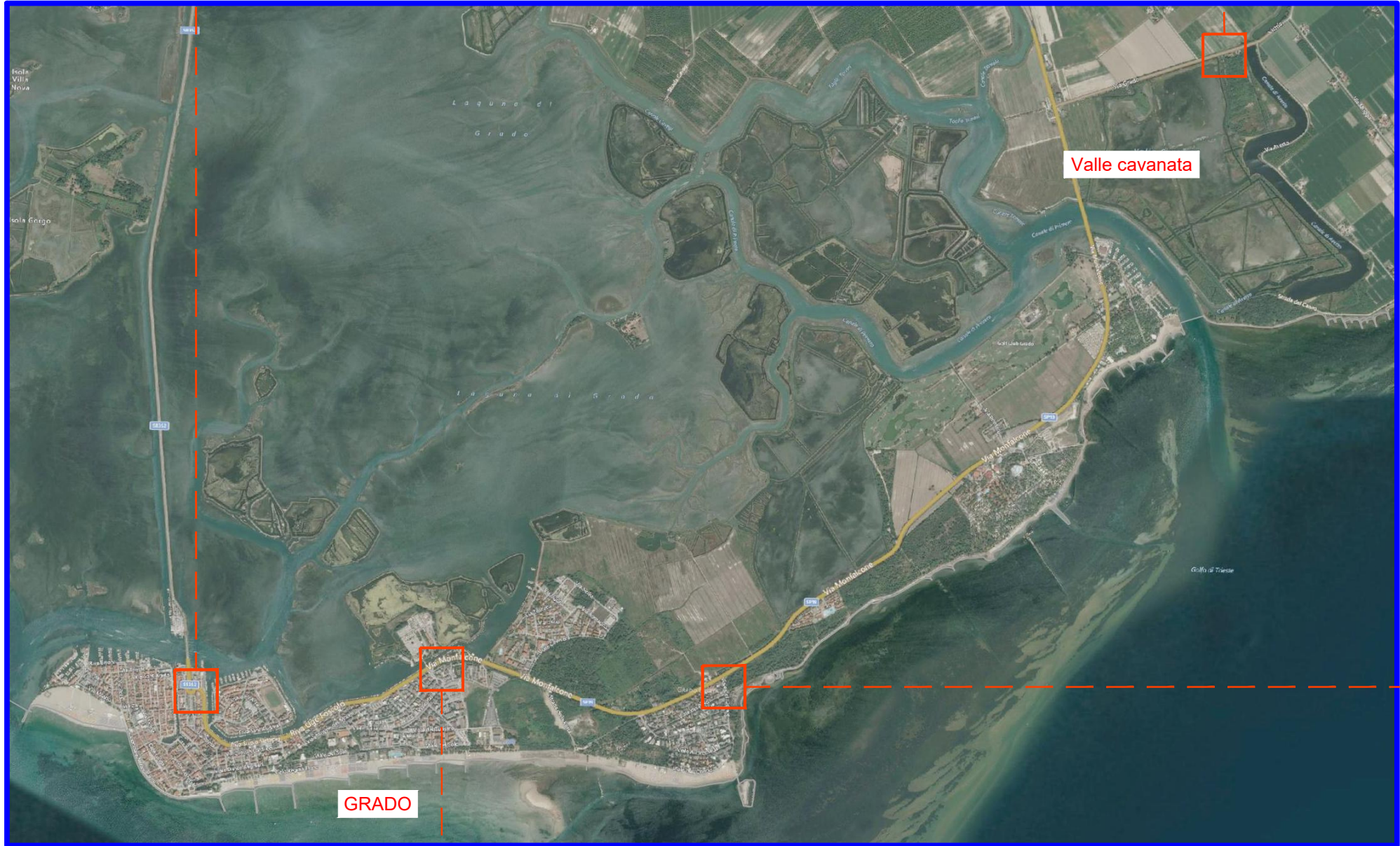
INQUADRAMENTO TERRITORIALE DEL COMUNE DI GRADO - SCALA 1:35.000