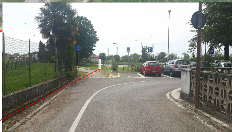
3 - Via Acidino