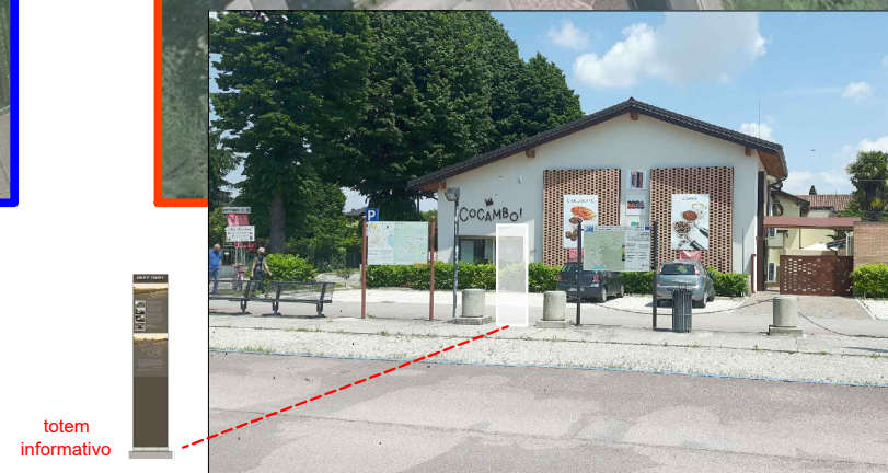
1 - Parceggio Terminal