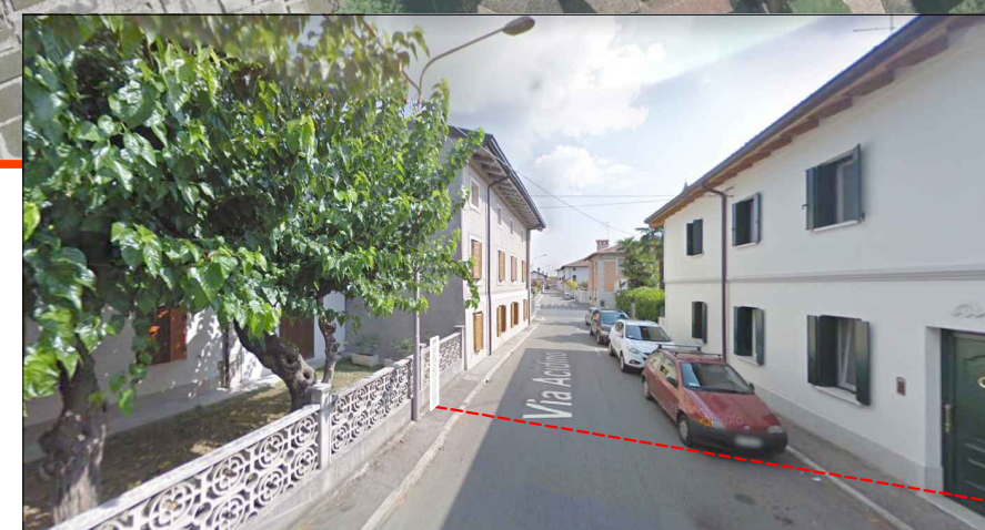
2 - Via Acidino