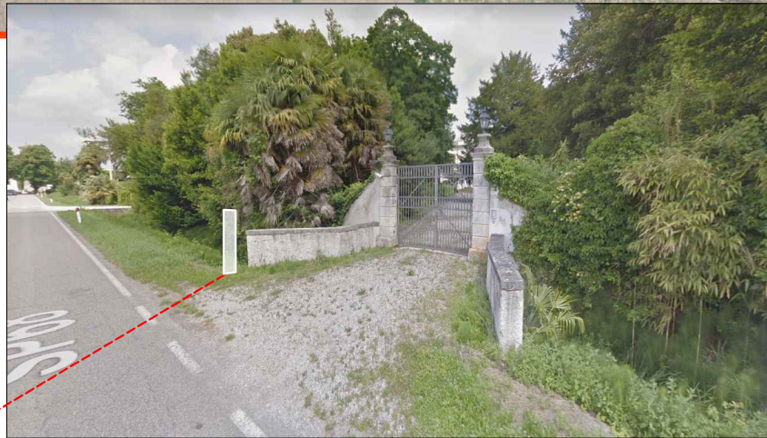
4 - Villa Chiozza