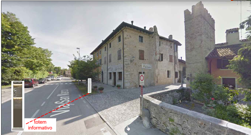
2 - Porta sud