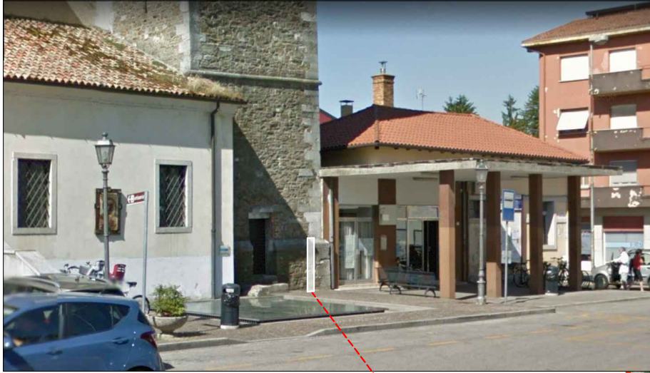
1 - Mosaico Carolingio