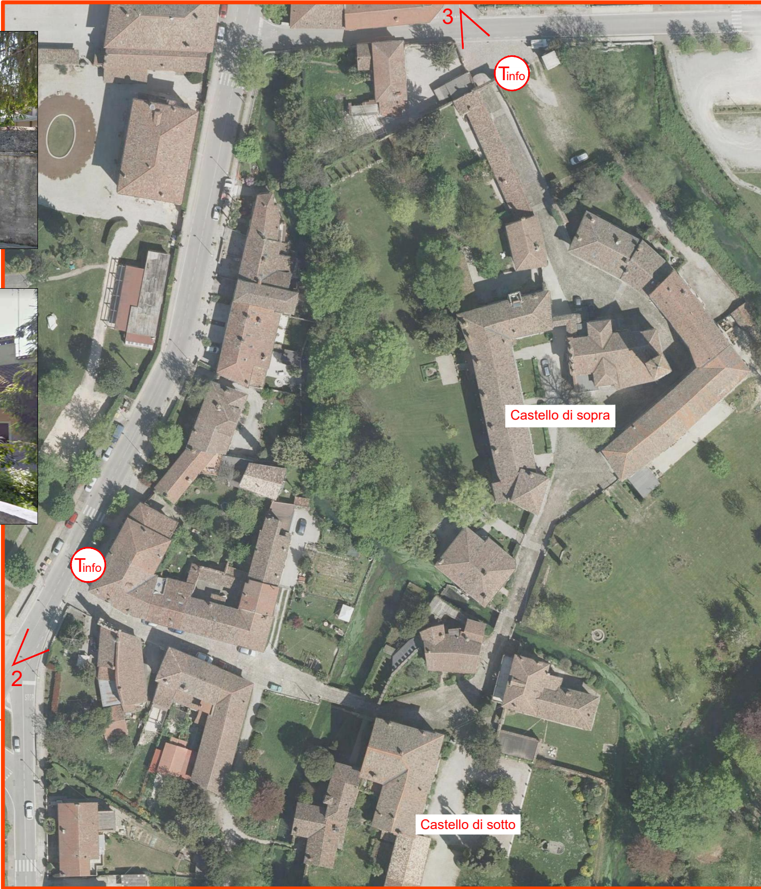
CASTELLI DI STRASSOLDO - PORTA NORD E SUD - SCALA 1:1.000