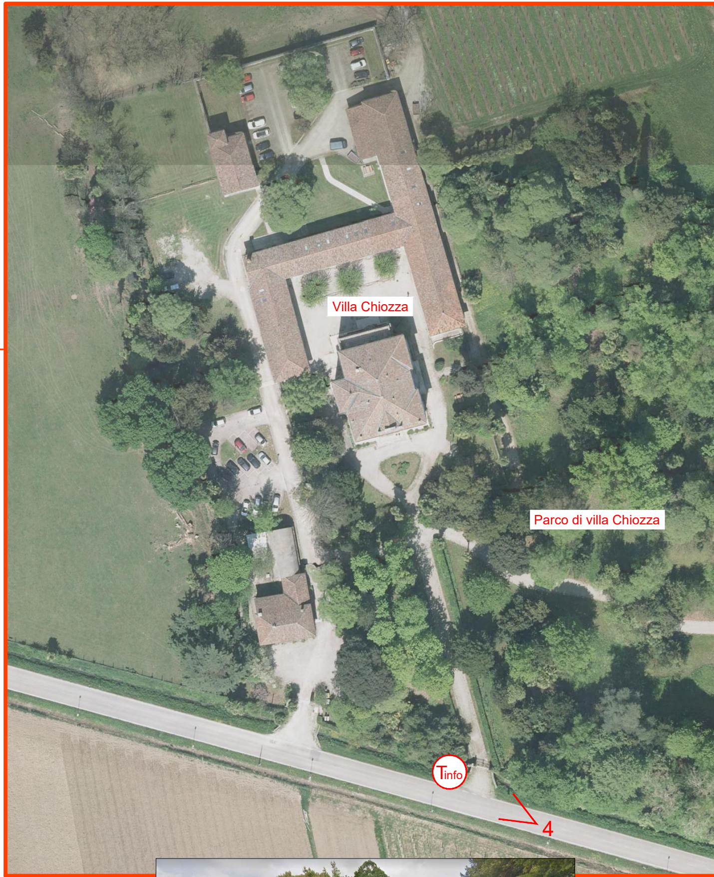
VILLA CHIOZZA IN LOCALITA' SCODOVACCA - SCALA 1:1.000