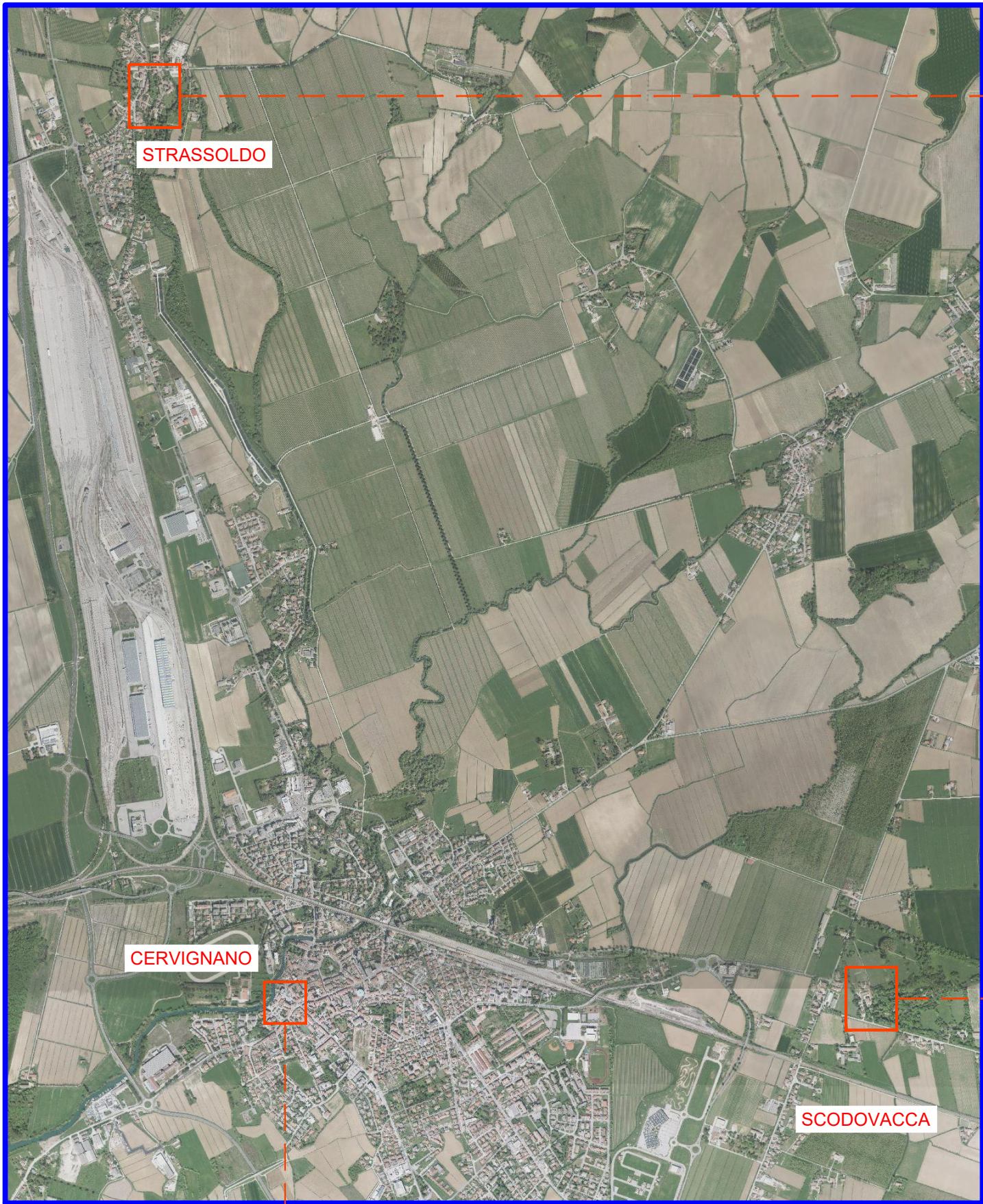
INQUADRAMENTO TERRITORIALE DEL COMUNE DI CERVIGNANO DEL FRIULI - SCALA 1:25.000