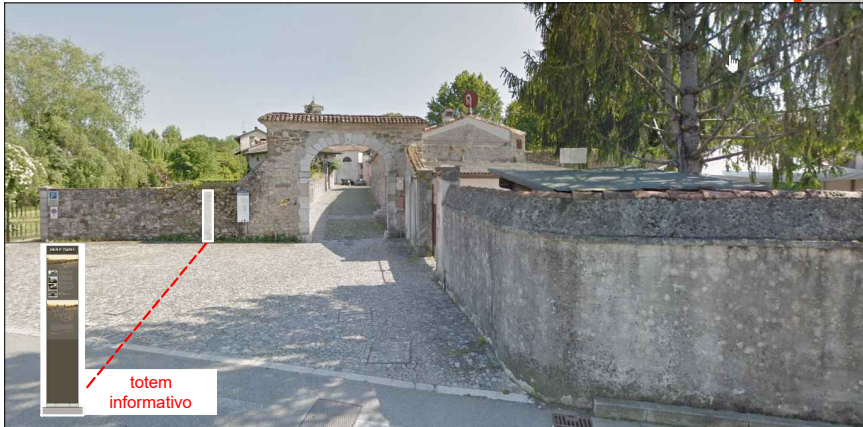
3 - Porta nord